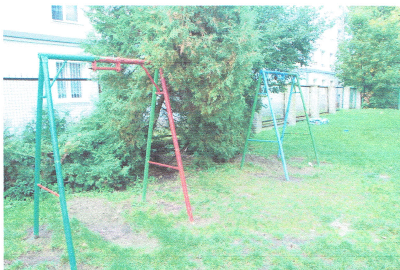
Fot. 20. Huśtawki 2 szt. - wyłączone z użytkowania.