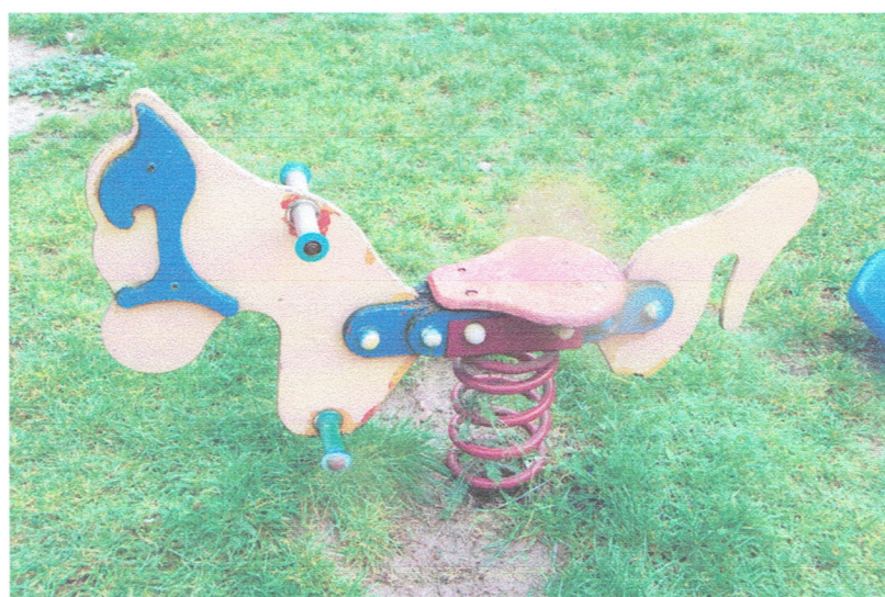
Fot. 14. Bujak nr 3.