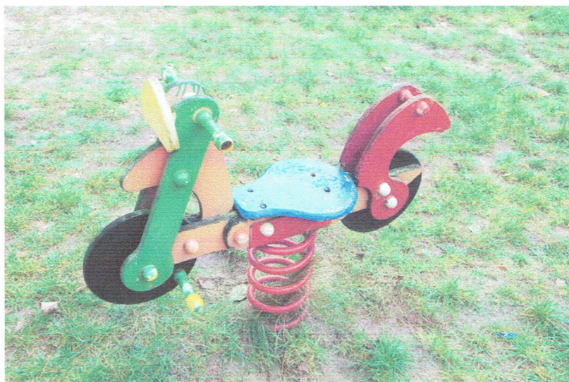
Fot. 4. Bujak nr 1..