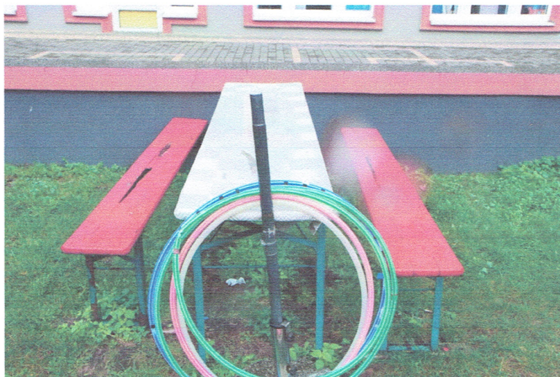
Fot. 10. Stolik z ławkami.