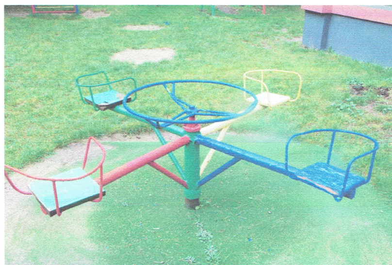
Fot. 12. Karuzela nr 1.