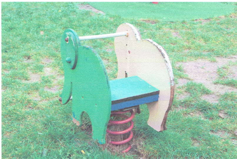
Fot. 7. Bujak nr 2.