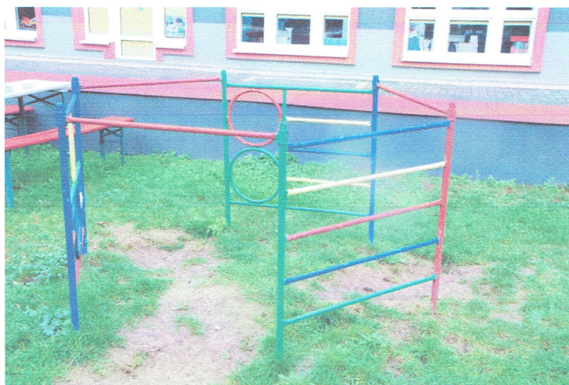
Fot. 9. Drabinka nr 1. Brak uwag.