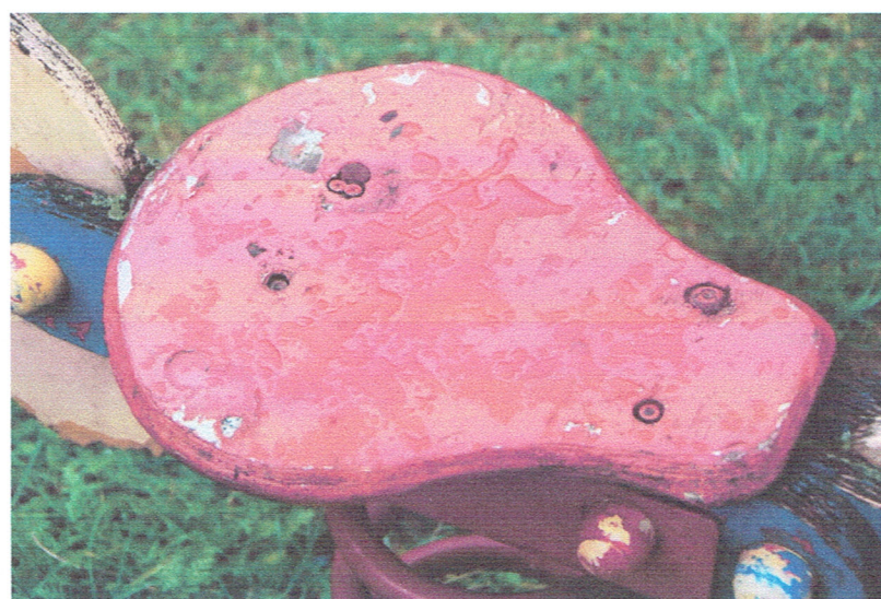
Fot. 15. Bujak nr 3 – Niestabilne siedzisko - umocować.