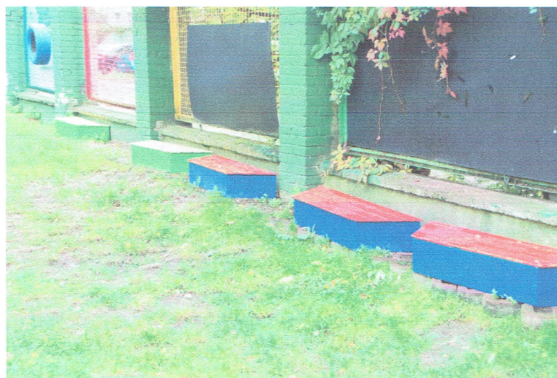
Fot. 21. Ławki 6 szt. Brak uwag.