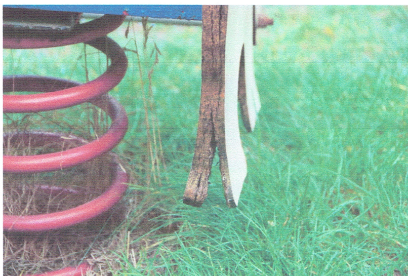
Fot. 8. Bujak nr 2. Zniszczona płyta – bujak do likwidacji.