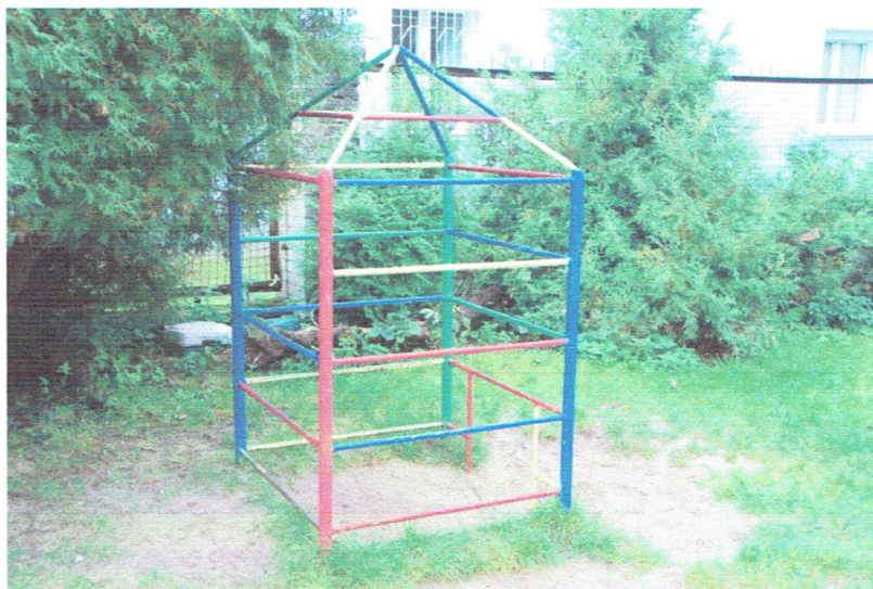
Fot. 19. Drabinka nr 2. Brak uwag.