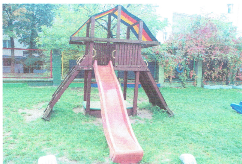
Fot. 6. Zabawka wielofunkcyjna. Brak uwag.