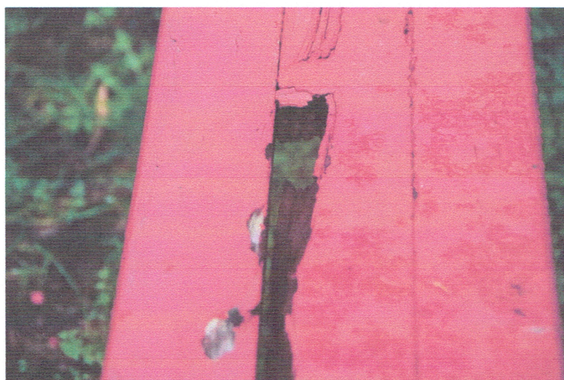
Fot. 11. Stolik z ławkami – zniszczone deski siedzisk do wymiany .