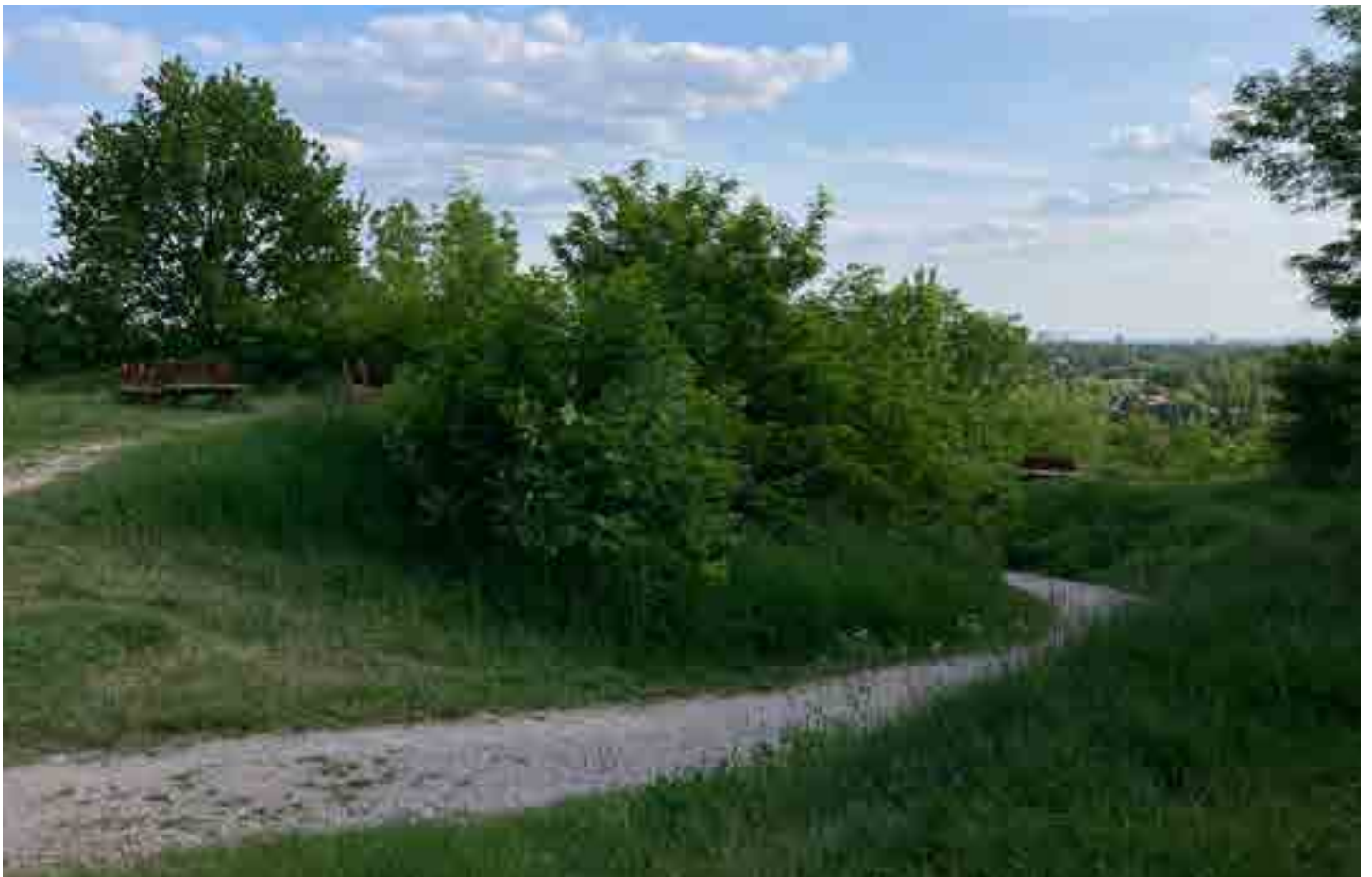
zdjęcia z maja 2023