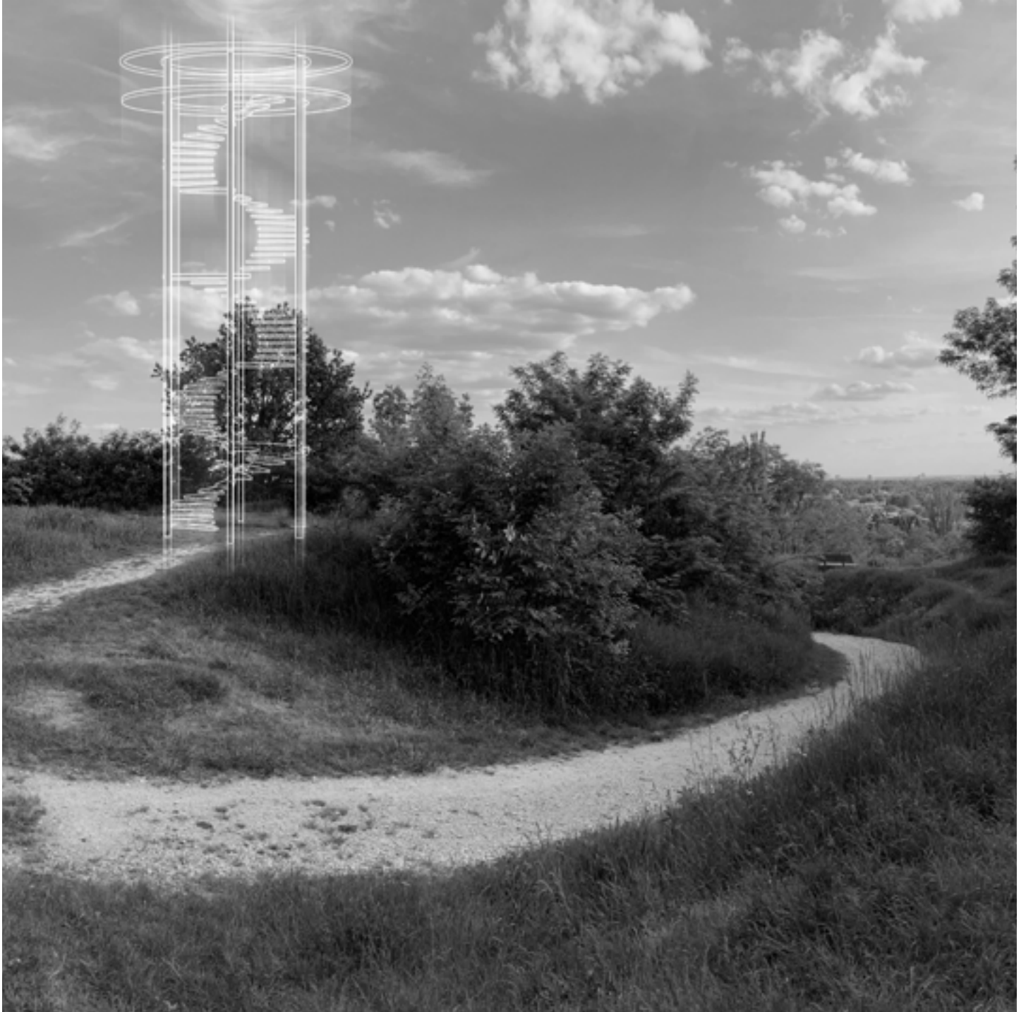
rysunek koncepcyjny wieży "naokoło"