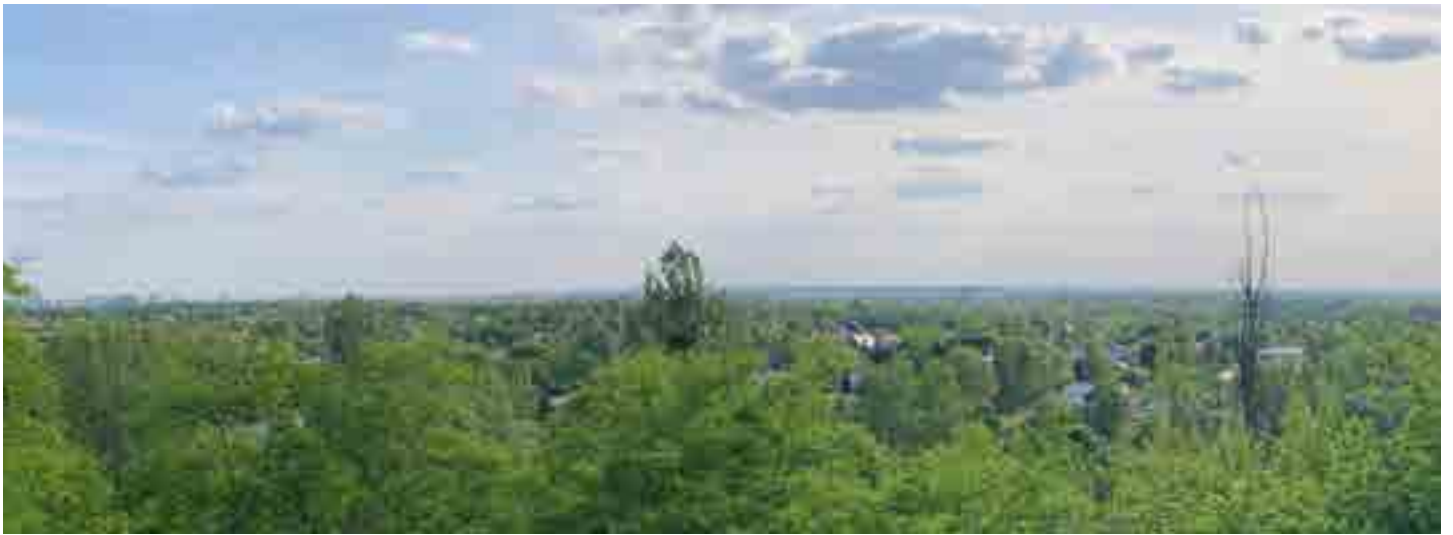
widok z góry Rogowskiej