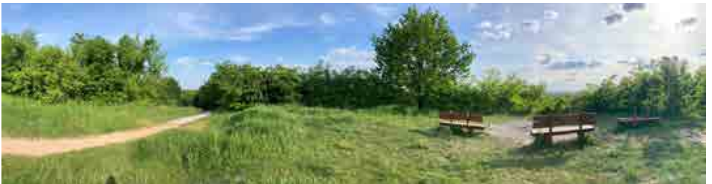
punkt widokowy obecnie